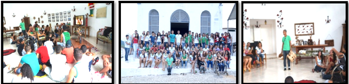
Figura 2. Visita ao Memorial.

Inicialmente visitamos o Memorial Cultural Dr. Wilson da Cunha Benevides, construído na antiga Caixa d'Água da cidade, único local que mantém guardado um pouco da história da cidade. Em todos os diários dos alunos esse momento foi registrado seja por fotos, desenhos, colagens ou textos. A visita foi um segundo passo de tomada de consciência.